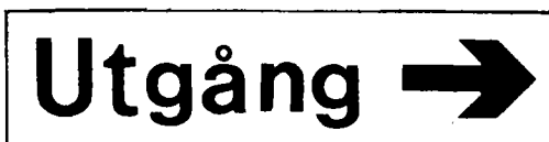
Figur 3. Riktningsskylt